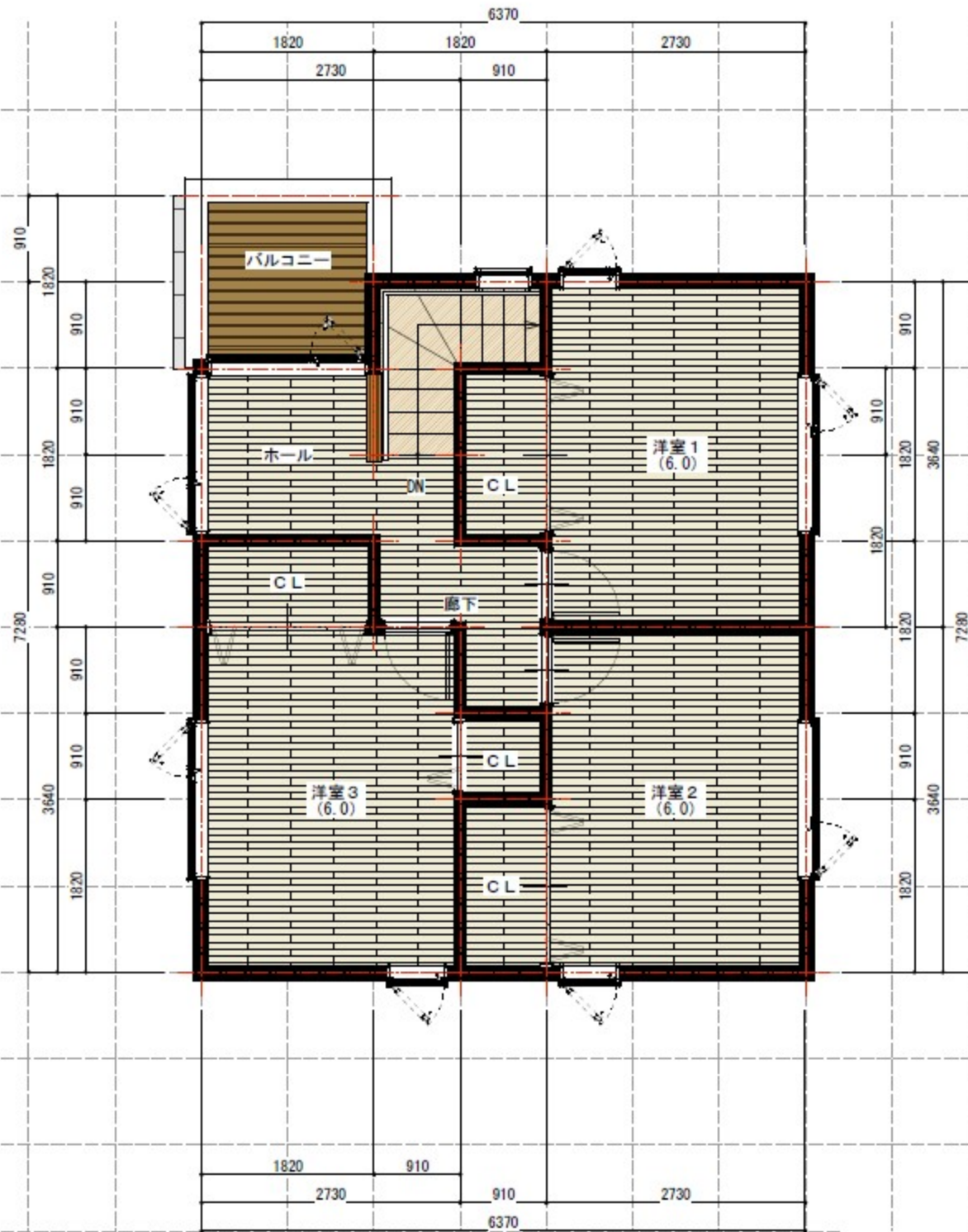
2階平面図 S=1 : 50